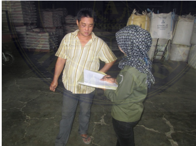
Gambar 3. Wawancara Dengan Pedagang Kilang Di Kecamatan Beringin