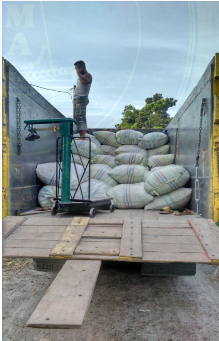
Gambar 5. Proses Pemasaran Gabah Dari Petani Ke Pedagang Pengumpul Di Desa Serdang