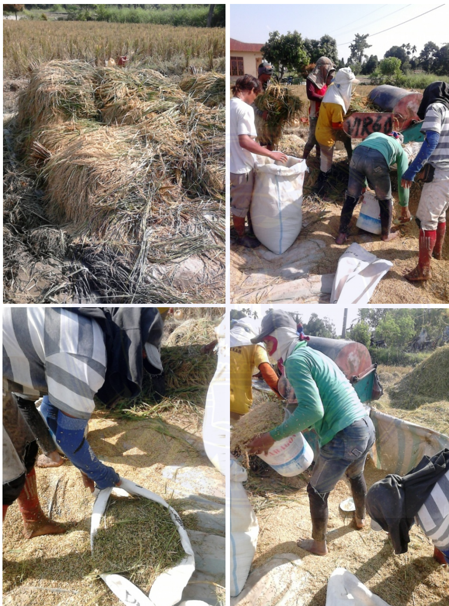
Gambar 4. Proses Perontokan Padi Dari Tangkainya (Jerami)