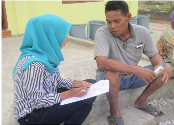
Gambar 2. Wawancara Dengan Pedagang Pengumpul Di Desa Serdang