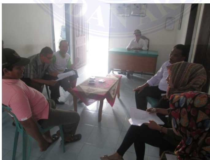
Gambar 1. Wawancara Dengan Petani Responden