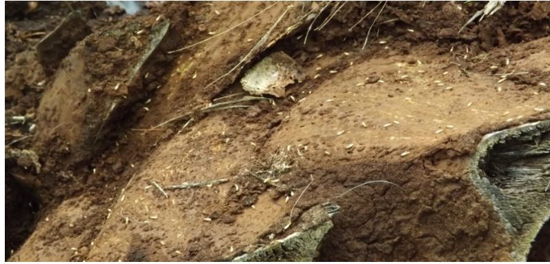
Gambar 1. Dampak Serangan Hama Rayap

Kira-kira 37% dari tanaman terserang berada di dekat saluran drainase. Pola serangannya adalah berkelompok. Walaupun kayu telah dibakar selama persiapan lahan, rayap dapat hidup di dalam tanah dan menghindari api dan sebagian dari mereka dapat bertahan hidup di dalam batang-batang yang berlubang bagian tengah. Serangan rayap biasanya dimulai pada titik-titik yang berdekatan dengan rayap. Dari titik-titik itu meluas ke areal lain. Dapat dipastikan tanaman-tanaman yang terserang secara fisiologis memang menarik bagi rayap tersebut (Nandika, 2003).