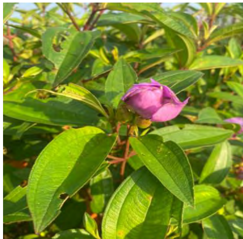
Gambar 1 : Daun Senggani

Tumbuhan senggani merupakan tumbuhan yang tumbuh liar di tempat-tempat yang mendapat cukup sinar matahari, seperti di lereng gunung, semak belukar, lapangan yang tidak terlalu gersang, atau di daerah objek wisata sebagai tanaman hias. Tumbuhan ini biasanya bisa ditemukan sampai pada ketinggian 1.650 meter dari permukaan laut (Hidayat, 2017).