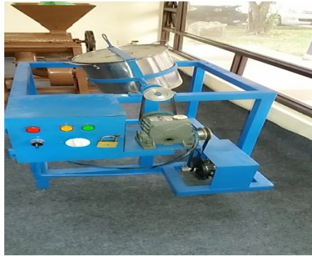
Gambar : 2.4 Mesin Pencampur Bumbu Keripik Singkong

Secara garis besar pertimbangan dalam merancang mesin pencampur bumbu keripik singkong berdasarkan pada: