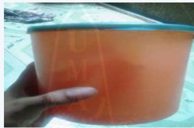
Gambar : 2.3 Pencampuran Secara Manual

Keripik singkong di aduk secara manual dimana pengadukan keripik singkong masih menggunakan cara konvensional yaitu di aduk secara alami dengan di masukan ke dalam sebuah toples, kemudian di goyang- goyang toples tersebut. Kelemahan dengan cara ini adalah keripik singkong yang di hasilkan lebih mudah ancur. Waktu produksi menjadi lebih lama dan masi ada keripik yang tidak merata tercampur bumbu tersebut