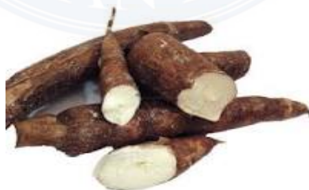
Gambar 2.1 : Ubi Kayu (Singkong)

Ketela pohon, ubi kayu, atau singkong ( Manihot Utilissima ) adalah perdu tahunan tropika dan subtropika dari suku Euphorbiaceae. Umbinya di kenal sebagai makanan pokok penghasil karbohidrat dan daunnya sebagai sayuran. Batangnya bisa mencapai 7 meter tingginya, dengan cabang agak jarang. Akar tunggang dengan sejumlah akar cabang yang kemudian membesar menjadi umbi akar yang dapat di makan. Ukuran umbi rata ratadengan cabang agak jarang. Akar tunggang dengan sejumlah akar cabang yang kemudian membesar menjadi umbi akar yang dapat di makan. Ukuran umbi rata rata bergaris tengah 2-3 cm dan panjang 50-80 cm, tergantung dari klon/kultivar. Bagian dalam umbinya berwarna putih atau ke kuning kuningan. Umbi singkong tidak tahan di simpan meskipun ditempatkan di lemari pendingin. Gejala kerusakan di tandai dengan keluarnya warna biru gelap akibat terbentuknya asam sianida yang bersifat meracun bagi manusia.