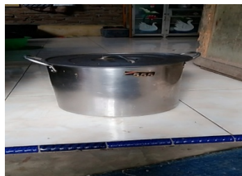
Gambar 2.8 : Tabung pencampur bumbu keripik singkong.

Tabung putar adalah bagian dari mesin pencampur bumbu keripik singkong. Untuk tempat keripik yang di putar berbentuk tabung dan berporasi (berlubang). Berikut gambar tabung pencampur bumbu keripik singkong.