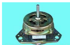
Gambar 2.9 : Gambar Motor Listrik

Motor listrik adalah komponen yang sangat penting dalam mesin yang di gunakan Sebagai sumber tenaga .Motor listrik ini berfungsi untuk menggerakkan poros dan puli sehingga tabung pencampur bumbu keripik singkong dapat berputar.