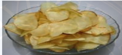
Gambar 2.2 : Gambar Keripik Singkong

Umbi singkong dapat diolah menjadi jenis makanan di masak dengan berbagai cara, Singkong banyak di gunakan pada berbagai masakan. Direbus untuk menggantikan kentang dan perlengkapan masakan. Tepung singkong dapat di gunakan mengganti tepung gandum, baik untuk pengidap alergi, dan dapat juga di buat menjadi keripik singkong