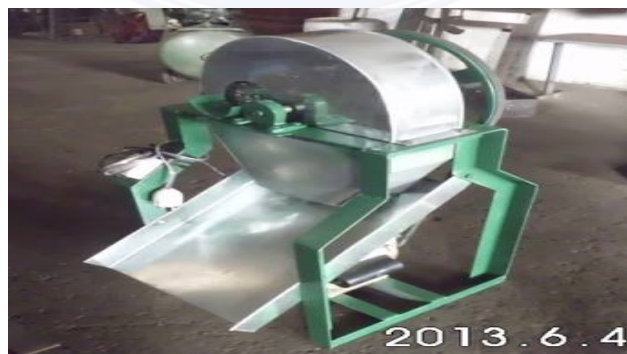
Gambar : 2.6 Mesin Pemotong Ubi