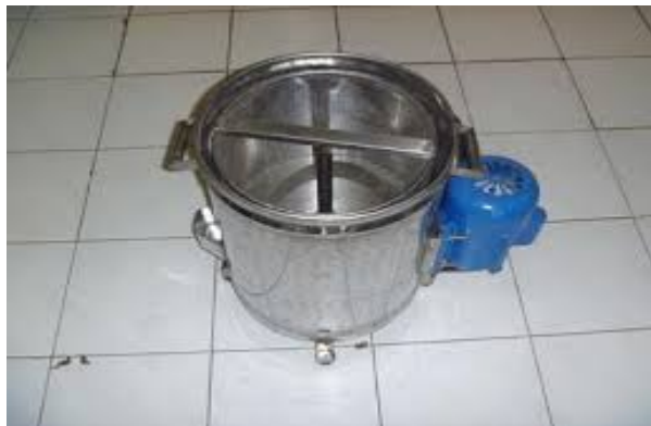
Gambar 2.5 mesin pengering minyak