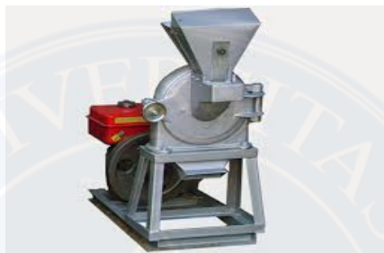
Gambar : 2.7 mesin penepung