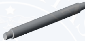
Gambar 2.12. Poros.

Menurut bentuk poros dapat digolongkan atas poros lurus umum, poros engkol sebagai poros utama dari mesin torak, dan lain-lain. Poros luwes untuk tranmisi daya kecil agar terdapat kebebasan bagi perubahan arah, dan lain-lain.