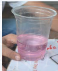
Gambar 3.5: Penimbangan Resin