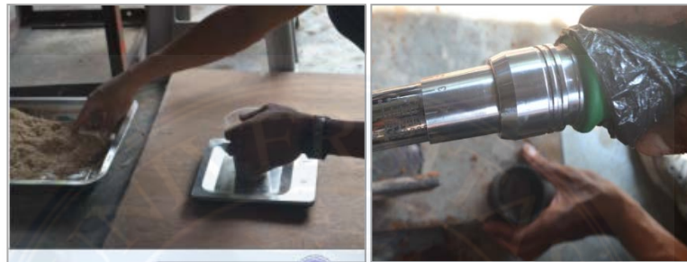
Gambar 3.4: Melakukan penimbangan dan pengaturan benang wol serta tekanan Proses pembuatan bahan komposit limbah batang Pisang Kepok ( Musa Paradisiaca ) dan benang wol menjadi bahan akustik atau peredam suara.