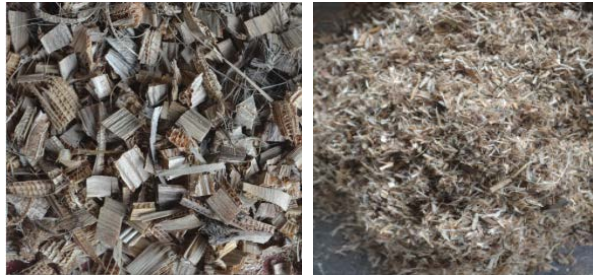
Gambar 3.3: Bahan sebelum proses penghalusan