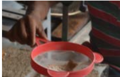
Gambar 3.1 Pengayakan Bahan

perolehannya sehingga hasil dari tiap serat berbeda-beda. Serat yang paling kuat dan ulet digunakan adalah serat abaka dan serat pisang kepok.