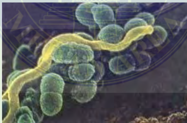
Abbildung 2. Mutierte Streptokokken