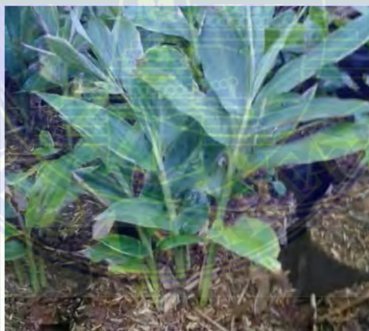
Abbildung 1. Kecombrang-Anlage

Die Kecombrang-Pflanze oder ( Etingera elatior ) ist eine Art Gewürzpflanze und ist eine ternaförmige mehrjährige Pflanze. Die Pflanze stammt ursprünglich aus Indonesien. Kecombrang wächst häufig in den Regionen Sumatra, Java und Sulawesi. Kecombrang ( Etingera elatior ) hat andere Namen Kincung (Medan), Siantan (Malaiisch), Kaalaa (Thai), Honje (Sundanesisch), Bongkot (Bali), die folgenden Blumen: Königreich: Plantae (Pflanzen), Unterreich: Tracheobionta (Gefäßpflanzen), Divisionen: Magnoliophyta (Blütenpflanzen), Klasse: Liliopsida (einteilig oder monokotyledonisch), Ordnung: Zingiberales (Ingwer-Ingwer-Tribus), Gattung: Etingera und Art: Etingera elatior (Tjitrosoepomo, 2005).