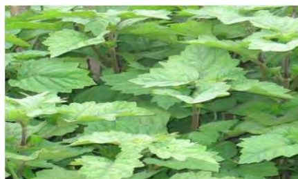
Gambar 1. Tanaman nilam

Kingdom : plantae Division : Angiospermae Class : Dicotyledonae Order : lamiales