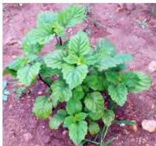
Abbildung 2. Aceh-Patschuli

Aceh-Patschuli ist eine empfohlene Standardpflanze für den Export, da sie ein unverwechselbares Aroma und eine hohe Trockenblattölausbeute hat, die 2,5 % im Vergleich zu anderen Arten beträgt. Patchouli Aceh wurde erstmals bekannt und in fast allen Gebieten von