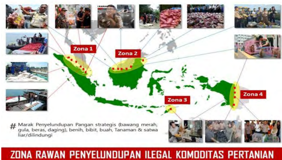
Gambar 1 Pemetaan Zona Rawan Penyelundupan Komoditas Pertanian Badan Karantina Pertanian.