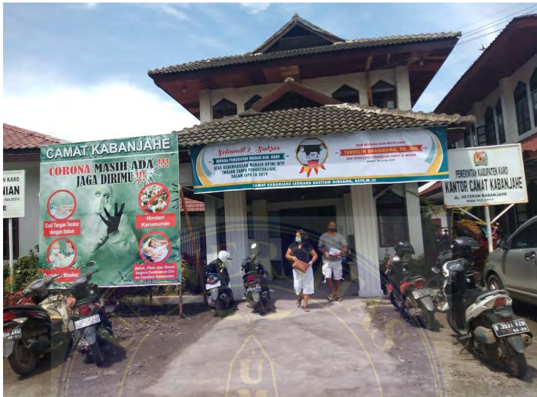
Gambar 4.1 Kondisi depan Kantor Kecamatan Kabanjahe Kabupaten Karo