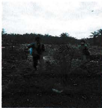
Gambar 2. Pemupukan Daun pada TBM I

Aplikasi pemupukan yang dilakukan peserta Praktek Kerja Lapangan Universitas Medan Area di PT. Perkebunan Nusantara Unit Usaha Tanah Itam Ulu , 2 Agustus 2019 tepatnya di Afdeling II hari Jumat harus dilakukan dengan benar agar biaya yang dikeluarkan tidak sia – sia dan berdampak pada produktivitas yang rendah. Alat dan bahan yang digunakan untuk aplikasi pemupukan adalah ember, pupuk hantu, air, gelas ukur dan keff. Pemupukan di TBM dilakukan menurut bagan pemupukan yang didasarkan atas umur tanaman.