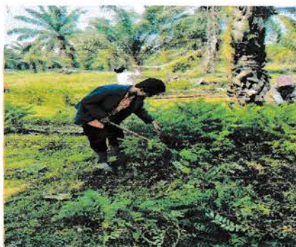
Gambar 5. Dongkelan Anak Kayu pada TM 2000

Dongkelan Anak Kayu dilakukan oleh peserta Praktek Kerja Lapangan Universitas Medan Area di PT. Perkebunan Nusantara IV Unit Usaha Tanah Itam Ulu tepatnya di Afdeling II pada hari Rabu, 31 Juli 2019 dilakukan dengan cara menggunakan alat dolan (dodos dongkelan).