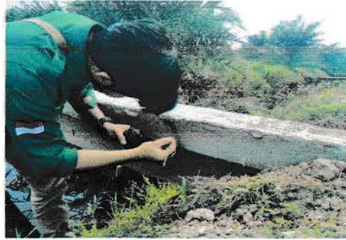
Gambar 3. Membuat Kode Inventarisasi pada Areal TBM

dengan memberi tanda pada tiap jembatan yang telah diselesaikan oleh pemborong.