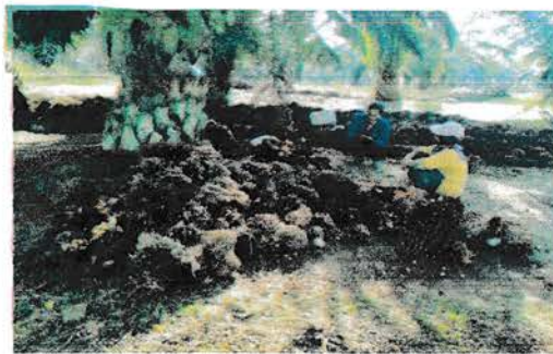
Gambar 4. Proses Pengetekan TBS

Pengetekan TBS dilakukan oleh peserta Praktek Kerja Lapangan Universitas Medan Area di PT. Perkebunan Nusantara IV Unit Usaha Tanah Itam Ulu tepatnya di Afdeling II pada hari Selasa, 13 Agustus 2019 dilakukan dengan cara TBS yang beratnya < 3 Kg dipukul dengan menggunakan jangkar, sampai brondolan terlepas dari tandan.