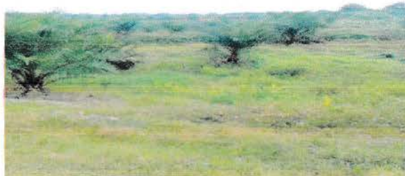
Gambar 1. Tanaman Kelapa Sawit Belum Menghasilkan

Mahasiswa Praktek Kerja Lapangan Fakultas Pertanian Universitas Medan Area di PT Perkebunan Nusantara IV Unit Usaha Tanah Itam Ulu tidak melakukan kegiatan pembibitan dikarenakan PT Perkebunan Nusantara IV Unit Usaha Tanah Itam Ulu sudah bekerja sama dengan PT Perkebunan Nusantara IV Bah Jambi.