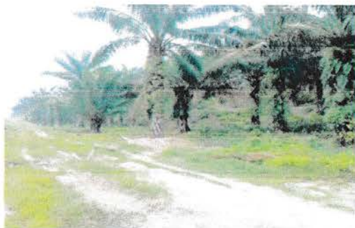
Gambar 5. Tanaman Kelapa Sawit Tanaman Menghasilkan 2000

(TM) kelapa sawit sangat perlu dilakukan. Dan lebih jelas berapa luasan Tanaman Menghasilkan Pada kebun Tanah Itam Ulu dijelaskan pada tabel dibawah ini.