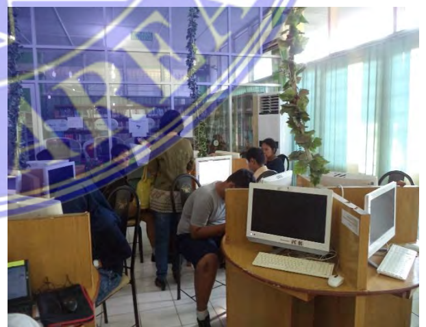
Dokumentasi Saat Penyebaran Kuesioner di Perpustakaan Kota Medan Senin, 03 Februari 2016