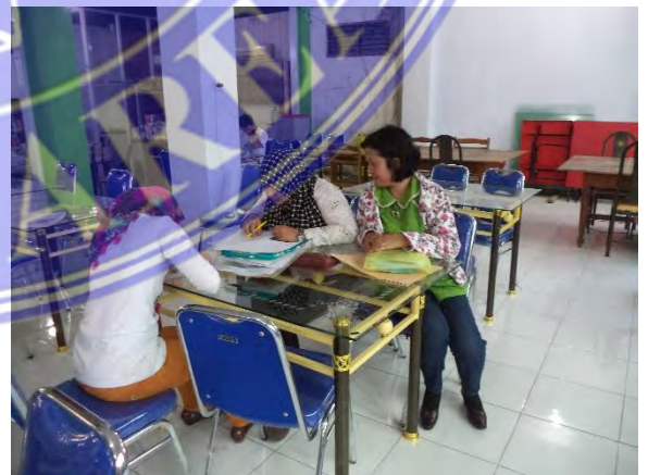
Dokumentasi Saat Penyebaran Kuesioner di Perpustakaan Kota Medan Senin, 22 Januari 2016