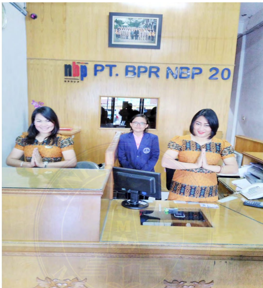
Kondisi Front Office Of PT. Bank Perkreditan Rakyat NBP 20 Deli Tua, 24 Februari 2017, pukul 10.49 WIB.