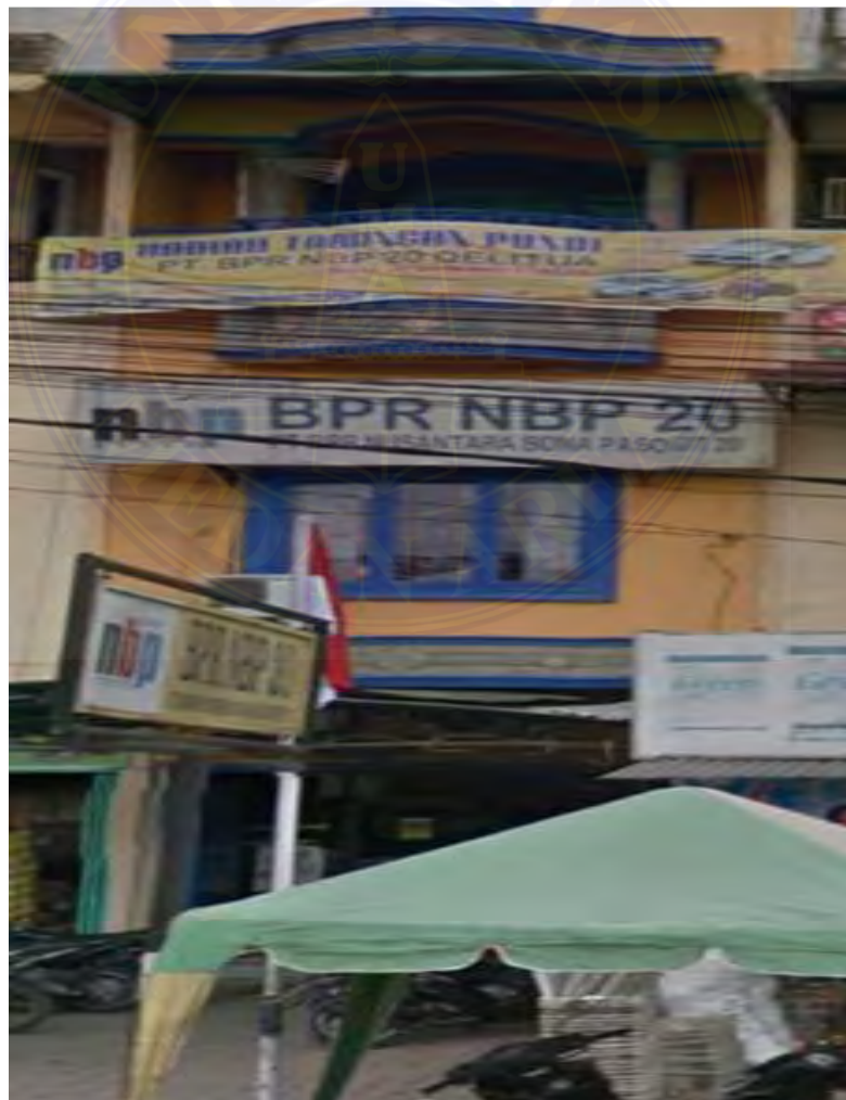
Lokasi Penelitian PT. Bank Perkreditan Rakyat NBP 20 Deli Tua