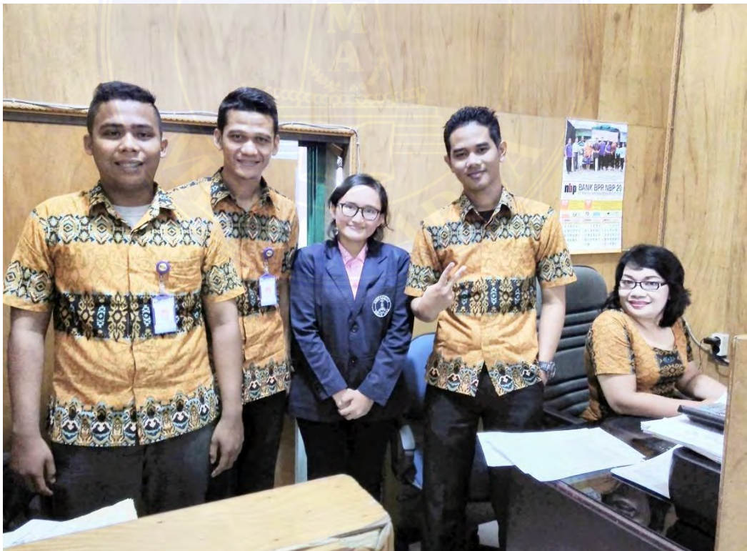
Kondisi Back Office Of PT. Bank Perkreditan Rakyat NBP 20 Deli Tua, 24 Februari 2017, pukul 10.52 WIB.