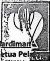
Hardiman Ketua Pelaksana Harian