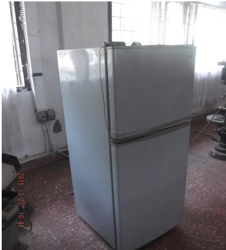
Gambar 3.1 tipe mesin pendingin makanan 2 pintu

Dalam pelaksanaan penelitian ini peralatan uji yang digunakan berupa seperangkat mesin pendingin makanan ( Kulkas ) dengan tipe Mesin pendingin 2 pintu ( portable ).